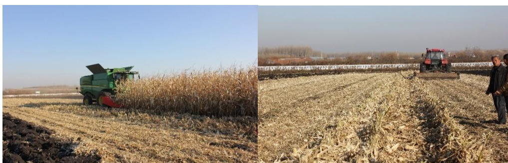
图 2 玉米收获及秸秆粉碎

秋季玉米联合收割机收获后，采用秸秆粉碎机对散落的秸秆进行二次粉碎，使秸秆长度在 10 cm 以下，均匀地分布在田面上。