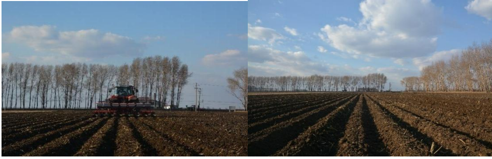
图 6 起垄作业