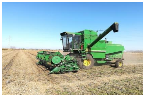
图 7 大豆收获秸秆覆盖作业

在大豆茎叶及豆荚变黄，豆粒归圆及落叶达 90%以上时使用联合收割机进行收获，割茬高度以不留底荚为准，一般为 5—6 cm。收获后的豆秸抛撒在田面上，不进行任何耕作处理。