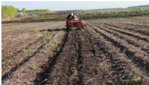
图 8 豆茬免耕播种玉米