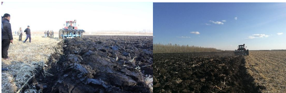
图 4 秸秆深混还田作业

耕深度 30—35 cm，将秸秆或秸秆和有机肥全部翻混于 0—30 cm 或 35 cm 土层中。作业过程中要求不出垄沟，表面外漏秸秆较少。