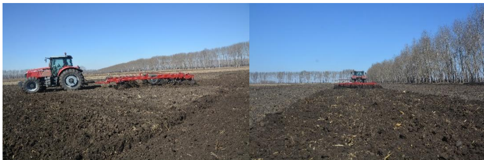
图 5 重耙作业

深翻作业完成后，晒垡 3—5 天为土壤降湿度，再用重耙机呈对角线方向耙地 2 次，耙地后保证无立垡、无坐垡、残留的秸秆及根茬翻压干净。