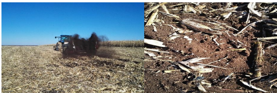
图 3 有机肥抛撒作业

在需要进行秸秆配合有机肥深混还田的区域，在秸秆粉碎后进行有机肥抛撒作业。使用有机肥抛撒车，将腐熟发酵后的有机肥地抛撒在田面上，有机肥施用量为每公顷 45 t。